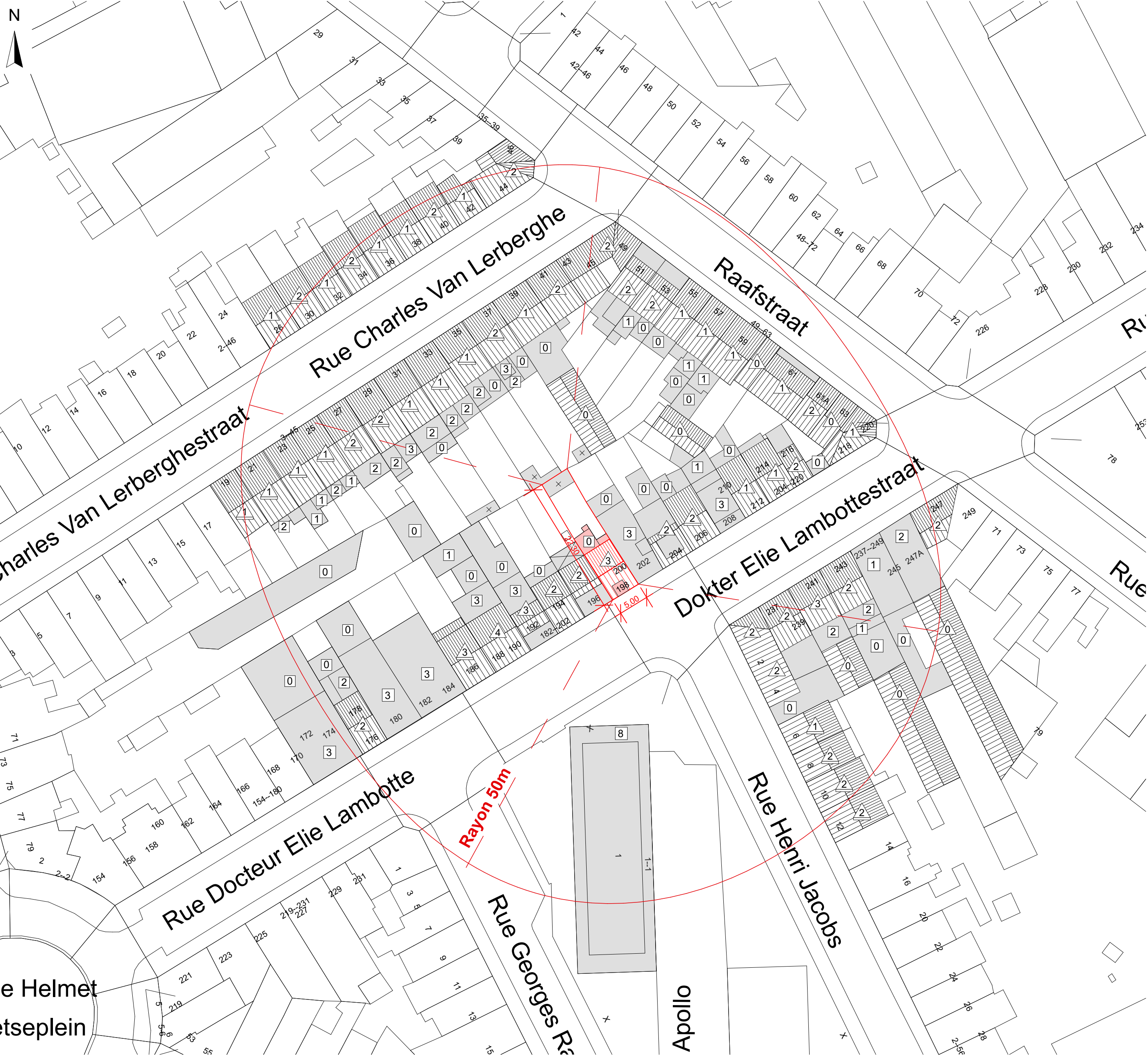
IMP 02 Plan de situation 1:500