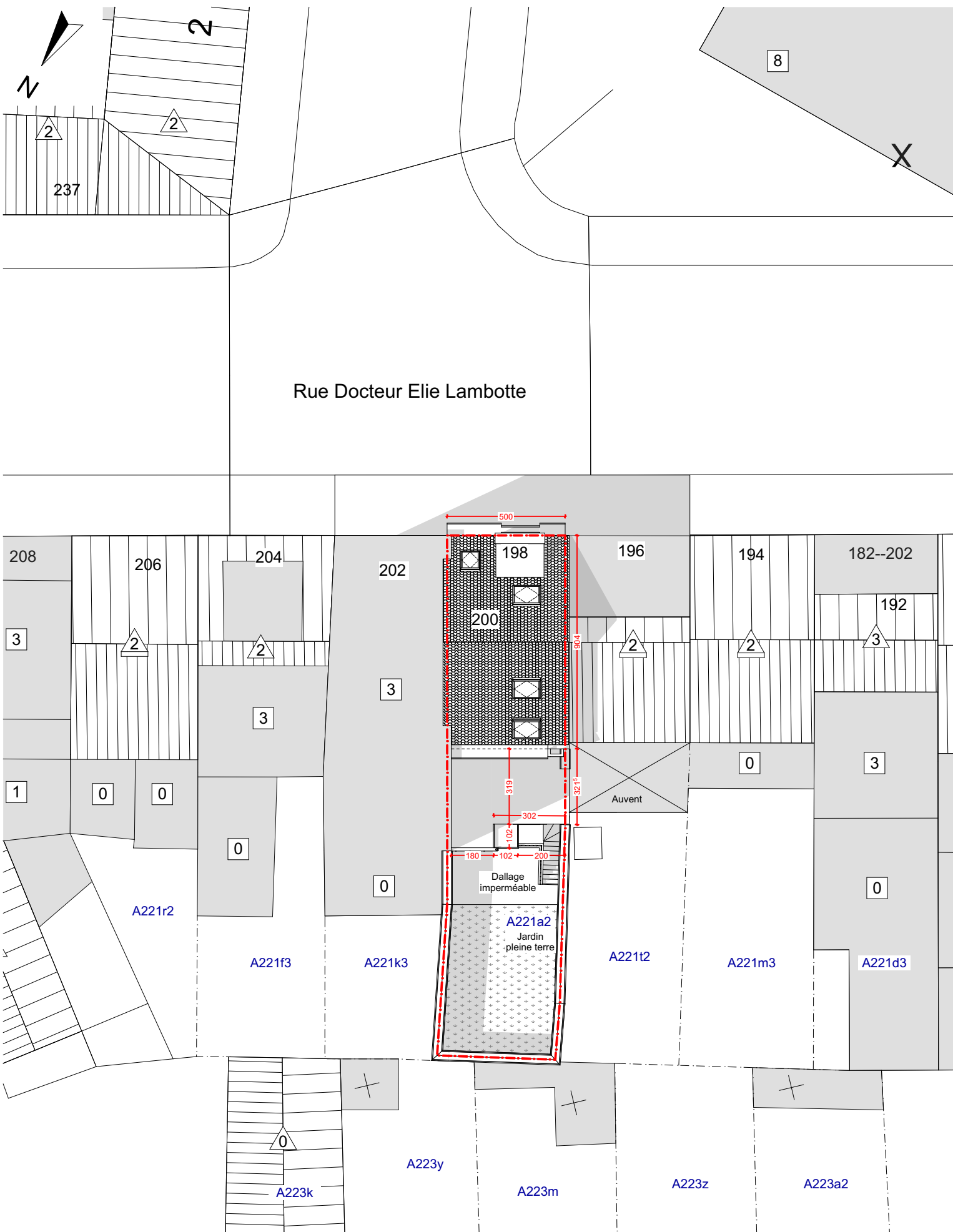
PM Plan d'implantation SP 1:200